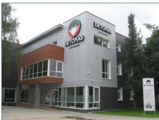
Kaunas, 2008 m.