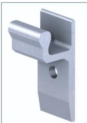
DHS: Direkt-Halter-System - tiesioginio tvirtinimo sistema