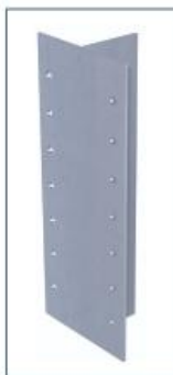
T-profilis 90/50/2 mm.