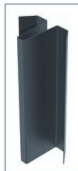
Vertikaliosios siūlės profilis.

Laikančiųjų profilių perforacija tiksliai atitinka tvirtinimo elementų suderinamumą. Tokiu būdu garantuojamas labai tikslus nepertraukiamas montžas, suteikiama galimybė montuoti įvairius „Creaton Tonality“ fasado apdailos plytelių variantus.