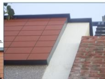
Telšiai, 2008 m.