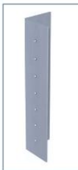
L-profilis 40/50/2 mm.