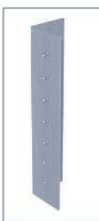
L-profilis 40/50/2 mm.