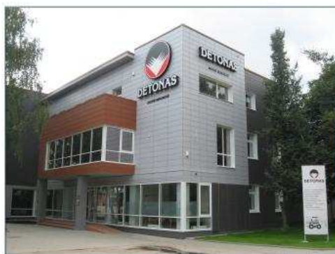
Kaunas, 2008 m.