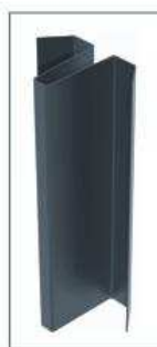
Vertikalsios siūlės profilis.

Laikančiųjų profilių perforacija tiksliai atitinka tvirtinimo elementų suderinamumą. Tokiu būdu garantuojamas labai tikslus nepertraukiamas montažas, suteikiama galimybė montuoti įvairius „Creaton Tonality“ fasado apdailos plytelių variantus.