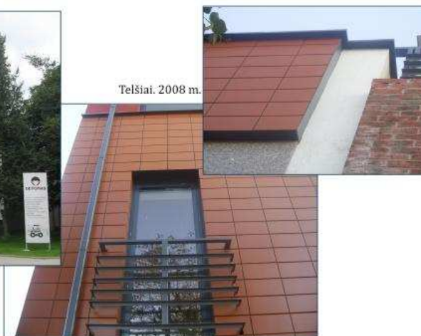
Telšiai, 2008 m.

UAB „DESTATA PROFIL“ www.destataprofil.lt