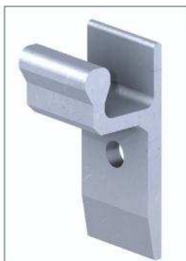
DHS: Direkt-Halter-System - tiesioginio tvirtinimo sistema