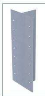
T-profilis 90/50/2 mm.